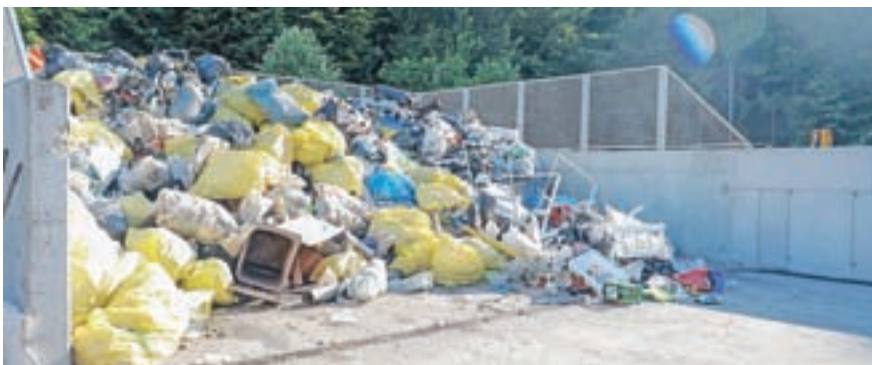
Pooblaščen družbe sproti pobirajo dogovorjene količine odpadne embalaže, tako da težav na tem področju letos ni, je zagotovil direktor Knific.

"Da. V preteklem letu smo začeli ure-jati okolico pokopališč, kar bomo nadaljevali tudi v letošnjem letu. Bi-stveno več pozornosti bomo namenili košnji pokopališč. Posodobili bomo tudi mrliške vežice. Dela smo že za-čeli v mrliških vežicah na Dovjem. Po končani sanaciji bosta tako v funkciji obe vežici."