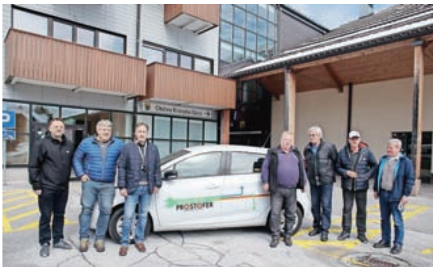
Projekt Prostofer je v kranjskogorski občini zaživel 6. maja. Prevoze opravljajo z električnim vozilom Renault Zoe, ki je v lasti Občine Kranjska Gora.

V projekt je za zdaj vključenih dvajset slovenskih občin, v zavodu Zlata mreža pa si želijo, da bi se vključile prav vse občine. Projekt ima namreč še eno dodano vrednost: osebe, ki potrebujejo prevoz, so običajno tudi osamljene, zato se na ta način povečuje tudi njihova socialna vključenost.