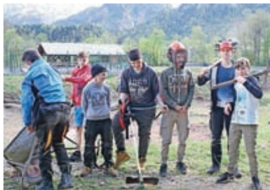
Osmošolci v akciji

”Vse uporabnike parka opozarjamo na lastno varnost pri uporabi igral in igrišč. Prav tako si ne želimo vandalizma in povzročanja škode. Zato naj uporabniki uporabljajo večnamenska igrala v skladu z namenom in hišnimi pravili ter v športnem duhu,” še opozarja Plavčak in v imenu društva vabi obiskovalce, predvsem pa člane društva na rekreacijsko druženje ter uporabo športnih naprav in objektov v Športnem parku Ruteč.