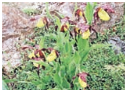
Lepi čveljč