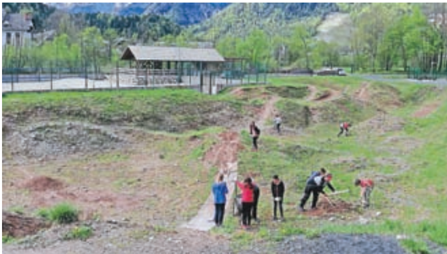
Prostovoljci so očistili in uredili tudi kolesarski paviljon.

”Še v tem letu se bo v parku dokončno uredil še prostor za piknik, ki ga bodo lahko za svoje potrebe najeli tako člani društva kot tudi zunanji člani. Cenik in pravila uporabe bo društvo objavilo na svojih spletnih straneh.