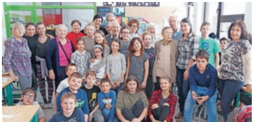
Zadovoljni z medsebojnim druženjem: šolarji in stanovalci doma Viharnik